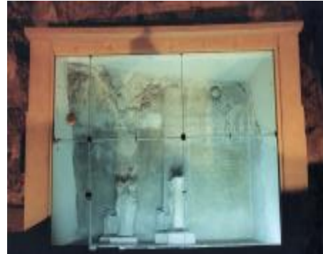
أحد ألواح الحدود من عصر إخناتون