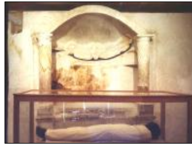
السريـر الجنائزى لمومياء إيزادورا