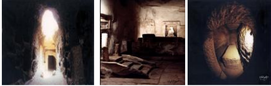
سراديب طائر الأييس وقرد البابون رمز الإله تحوت ( إله الحكمة )